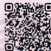
Схема сертификации: 1с (ГОСТ Р 53603-2020. Оценка соответствия. Схемы сертификации продукции в Российской Федерации).

Проверка подлинности сертификата соответствия